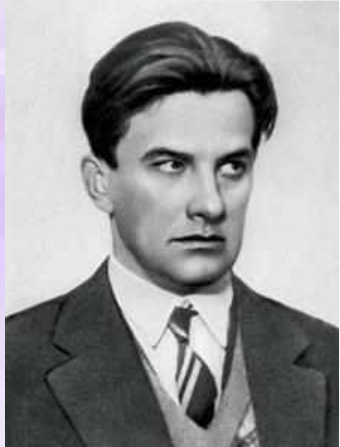
Владимир Владимирович Маяковский